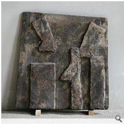
Hans Josephsohn; Ohne Titel, 1950–1951. Relief (Verz. Nr. 1024), 122 x 122 x 9.5 cm, Messing, Ed. 6 + 2ap