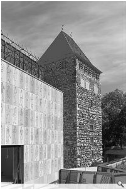
Gebäudedecke. © Diener & Diener; Foto: Serge Hasenböhler