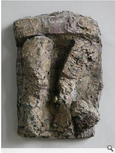
Hans Josephsohn; Ohne Titel, 1999. Relief (Verz. Nr. 1003), 103 x 73 x 936 cm, Messing, Ed. 3 + 2ap; Foto: Kesselhaus Josephsohn / Galerie Felix Lehner. Courtesy: Josephsohn Estate, Hauser & Wirth und Kesselhaus Josephsohn/ Galerie Felix Lehner