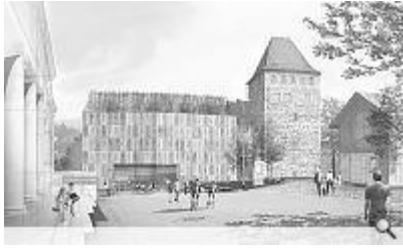
Visualisierung; © Diener & Diener